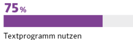
↖ Abb. 014 Die 5 digitalen Basiskompetenzen

Basis: Bevölkerung ab 14 Jahren (n=6.455); Top2 (Trifft voll und ganz zu/Trifft eher zu)